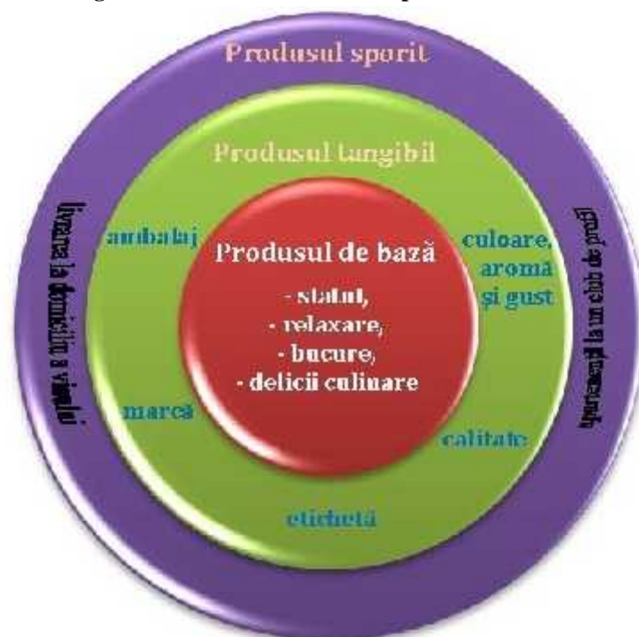
Figura nr. 2: Cele trei nivele ale produsului viticol